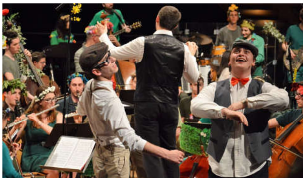
Illustration de « L'auberge du Cheval-Blanc » de Benatsky (2017)

Le prestigieux Concert Européen des Lycéens de Sarre et de Moselle (CESAM) intégré aux enseignements de l'option Musique ou des Arts du son au niveau 2 nde :